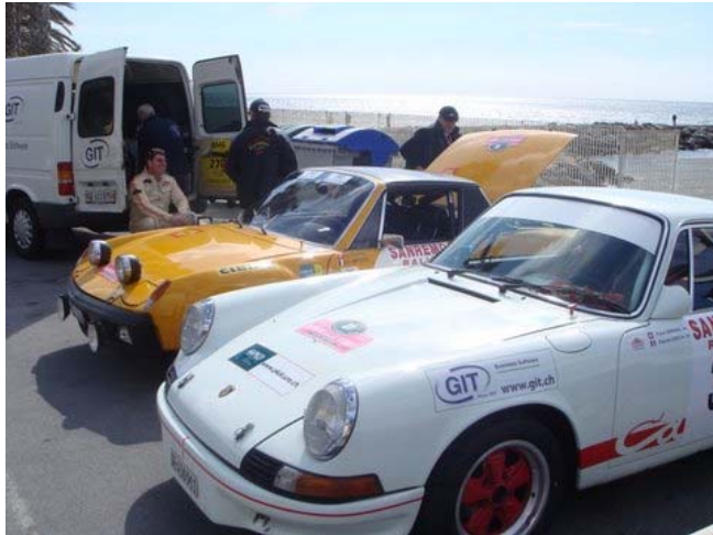
Notre camion d'assistance, et la très belle Porsche 916/6 de Claude

plus performantes et agressives les unes que les autres. Des équipes d'assistance avec des camions semi-remorques. Le temps maussade, et les routes de la première journée (très piégeuses, secteurs enneigés, recouverts de sciure et de déchets du bûcheronnage, nous ont plutôt avantage par rapport aux grosses Gr. 4 et nous terminons la première journée 14èmes au scratch, ce qui est mieux que nous pouvions rêver. Par contre, dans la dernière liaison nous ramenant au parc fermé, l'embrayage semble patiner. Ce n'est pas un réglage de la garde, et nous sommes obligés d'abandonner dès le départ du lendemain. Dur Dur, d'autant plus que nous étions si bien partis. Ce sera notre seul abandon de la saison.